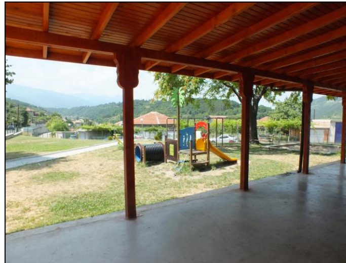
Детска площадка, кв. „Разсадника“

Със средства от общинския бюджет се извършва основен ремонт на „Детски комплекс – Белово“. Подменени са дограмата, подовите настилки, направена е вътрешна изолация.