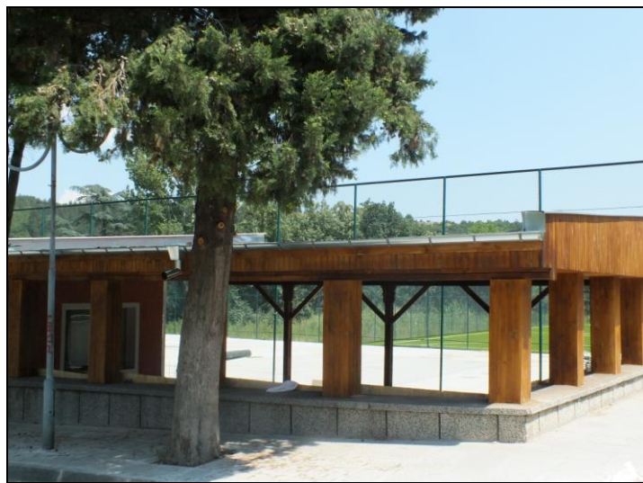
Спортна площадка, кв. „Разсадника“

Община Белово започна ремонт на спортната зала в града със средства на Министерството на младежта и спорта. Изгражда се и външно спортно игрище, което се финансира със средства от общинския бюджет.