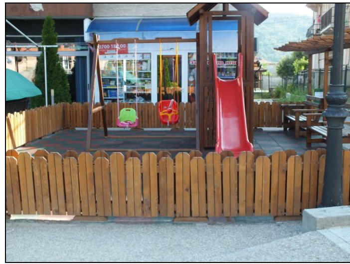
Детска площадка, пл. „Освобождение“, гр. Белово

Извърши се ремонт на санитарно-хигиенните помещения и кухненския блок, бяха осигурени нови електроуреди и обзавеждане.