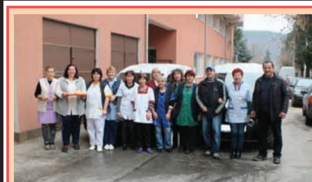
Два нови автомобила марка „Dacia Dokker Van“ бяха закупени за нуждите на „Домашен социален патронаж – Белово“

Всички регионални програми на радиото са достъпни в Интернет.