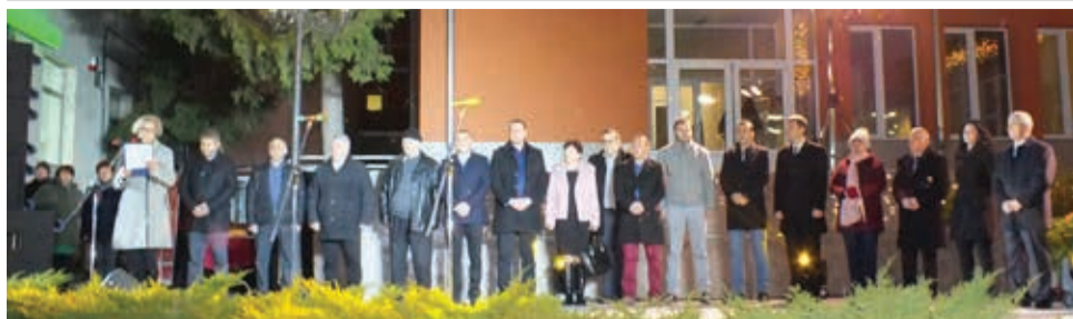
Беловци отбелязаха 140 години от освобождението си

По традиция и тази година в навечерието на своя празник беловци се събраха на централния площад „Освобождение“, за да изразят своята почит и признателност към загиналите руски, финландски и украински воители.