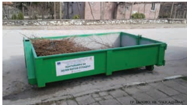
ГР. БЕЛОВО, КВ. „РАЗСАДНИКА“

Молим жителите на общината да използват контейнерите по предназначение!