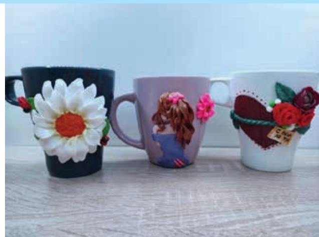
Марина Генова – изработка на чаши от полимерна глина