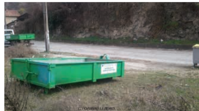
С. ГОЛБИНО СЕЛОВО