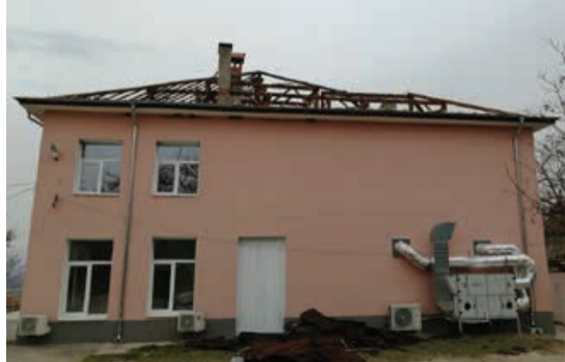
кв. Малко Белово

- Чапай - 1938“ в с. Дъбравите и „Христо Ботев - 1931“ в с. Габровица. Ремонтите се осъществяват от Община Белово!